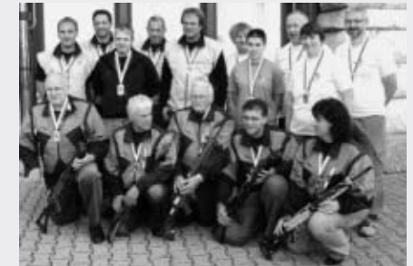
Rüscheegg-Graben FS (vorne), Frutigen SV (hinten links), Walperswil FS (hinten rechts)

Im Namen des Berner Schiesssportverbandes gratulieren wir den Heimenschwand Buchholterberg Schützen für den zugesprochenen Schweizermeistertitel in der Schweizerischen Gruppenmeisterschaft 2008 im Feld A recht herzlich.