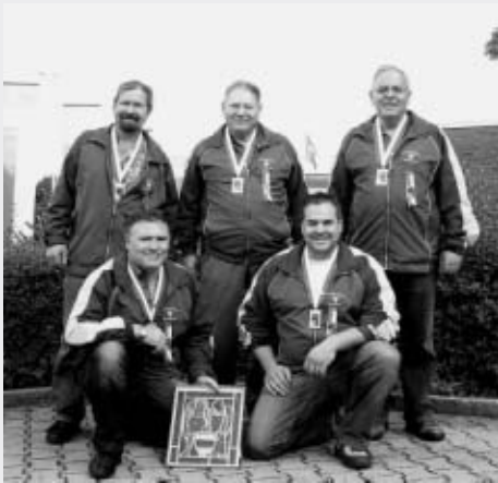
Schweizermeister Feld B Wattenwil b. Grundbach