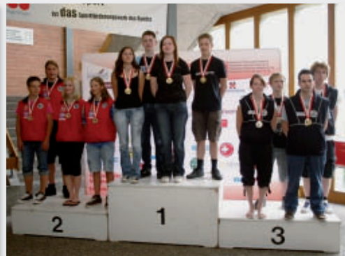
SSV Final GM G 50m Junioren