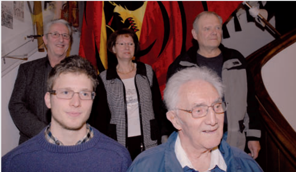
Alle Sieger BSSV JU + VE

Bericht mit den Resultaten siehe Inhalt Seite 62.