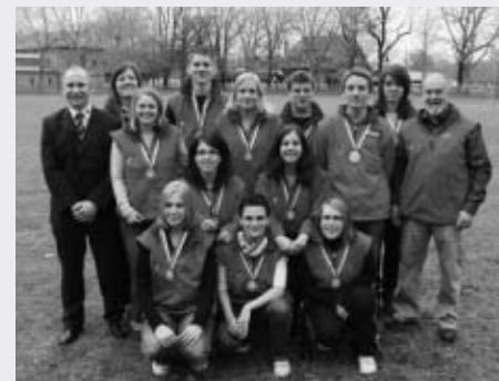
Siegermannschaft VM G10m Junioren