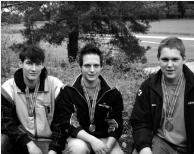
Sturmgewehr 90 Jugend