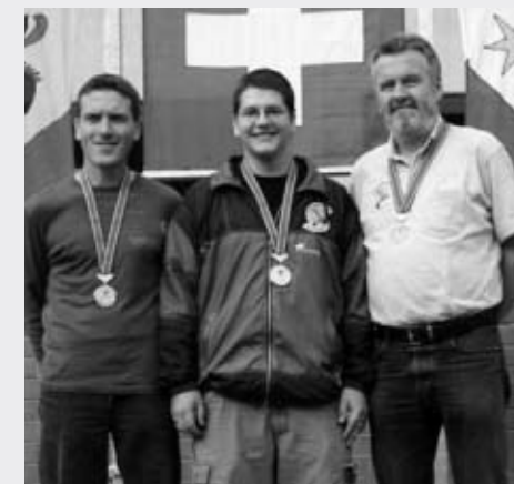
KM: Siegertrio Einzel P50m-A-Programm