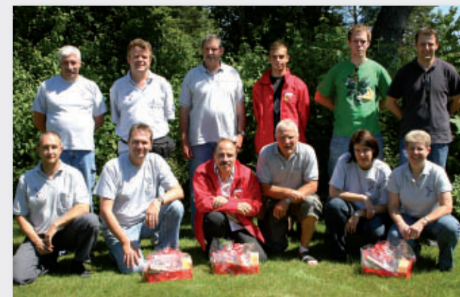
GM P 25m

2. Uetendorf 4, 2. Büren a/A, 3. Uetendorf 1