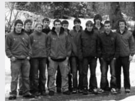
Juniorenkader Pistole im TL Magglingen