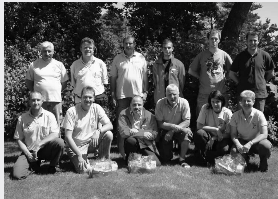
3. Uetendorf PS 4 1. Büren a/A PS 1 2. Uetendorf PS 1