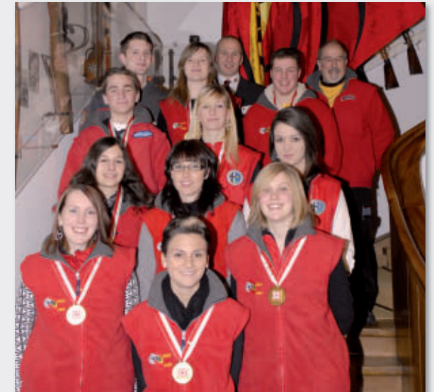
Juniorenkader BSSV SM G10m Verbandsmatch