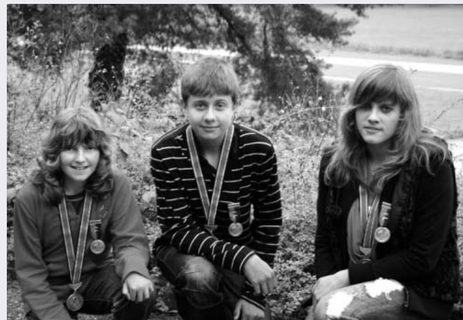
Sportpistole 25m Jugend