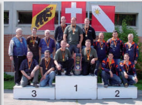
GM Final G 50m Elite

2. Buchholterberg, 1. Oberbalm, 3. Biel-Aegerten