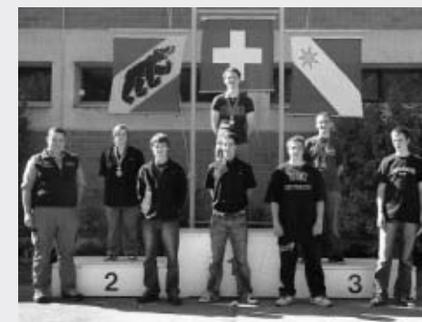
GM G50m Junioren