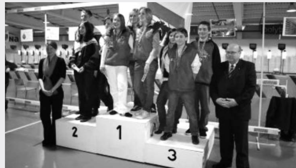
Berner Finaltage Münchenbuchsee Zollikofen GM G 10m Final Junioren 1. Thörishaus 2. Oberburg 3. LGS Aegerten-Armbrust

Diese Anlässe verliefen alle ohne einen Unfall und zur vollen Zufriedenheit aller Teilnehmer. Der Dank gehört selbstverständlich auch jedem Organisationskomitee und all den vielen Helfern, so wie den Sponsoren.