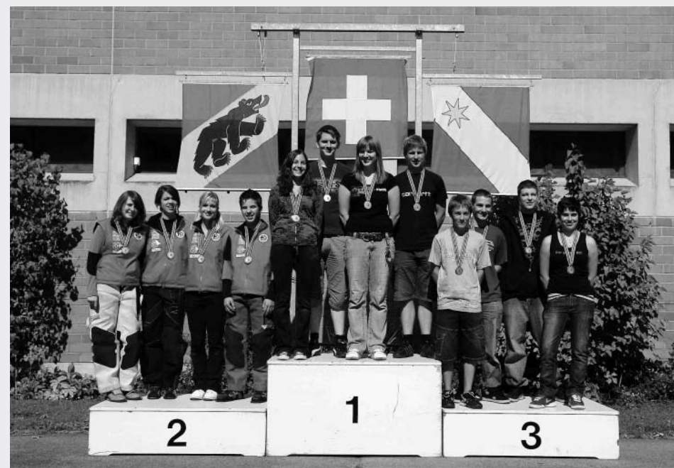
Kant. GM-Final G50m Junioren