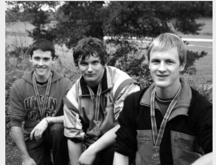
Sturmgewehr 90 Junioren