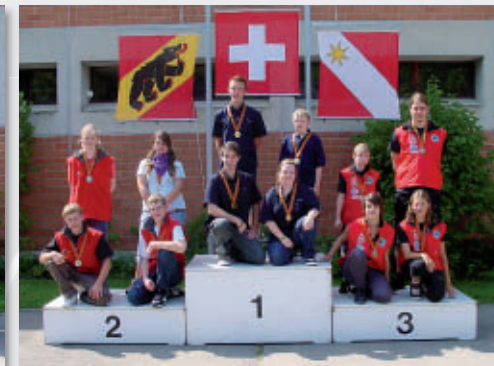
GM Final G 50m Junioren

2. Buchholterberg, 1. Oberbalm, 3. Biel-Aegerten