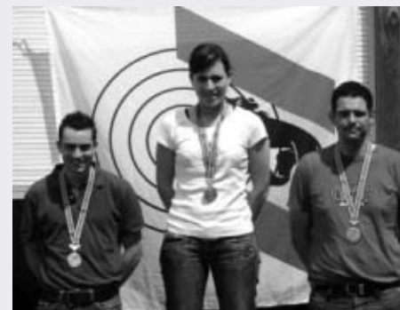
KM: Siegertrio, 3-Stellungsmatch, G50m

B-Gruppen: 1. Oberland 557.714 Pt., 2. Mittelland 545.000 Pt., 3. Emmental 538.400 Pt.