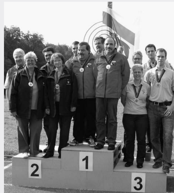
2. Schüpfen 1. Büren a/A 3. Uetendorf

Herzliche Gratulation an die Siegergruppen!