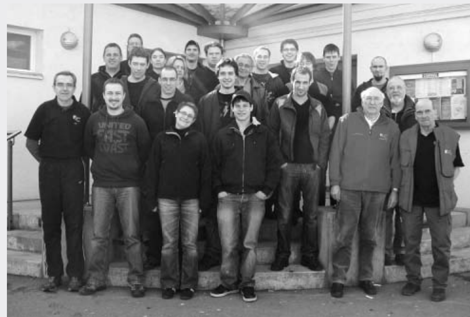
Ausbildung Ressort Schiesskurse

Les cours se sont souvent déroulés sur 1 jour, ce qui permet de mettre l'accent sur la position à genou et de démontrer aux participants(es) l'utilité de posséder un matériel adéquat.