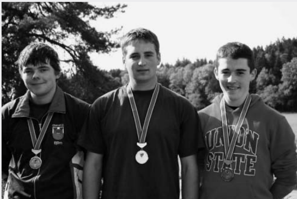
Sieger Kantonaler Jungschützertag

A nos monitrices, moniteurs et coachs de J+S va notre gratitude pour le travail effectué et nous leur souhaitons d'avoir la force de continuer ainsi au moment où ils sont confrontés à passablement de changements