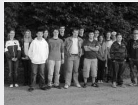
Juniorenkader Pistole am FM in Oberstammheim

Schon vom heutigen Tag haben wir sehr viel profitiert und freuen uns auf das Training vom Sonntag, bei dem wir uns mit der Abzugstechnik beschäftigen werden.