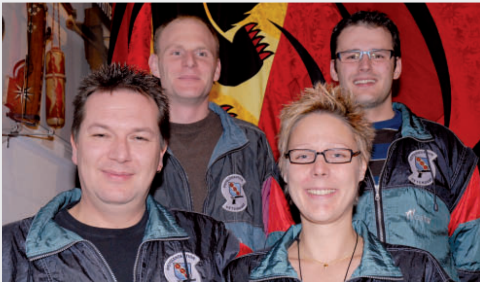
Uetendorf Pistolensektion SM P50m Sektionsmeisterschaft Feld D