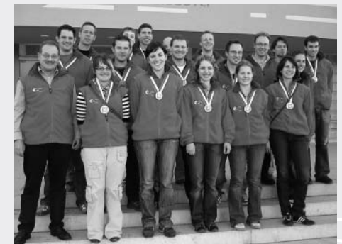
Bronzemannschaft VM G10m Elite