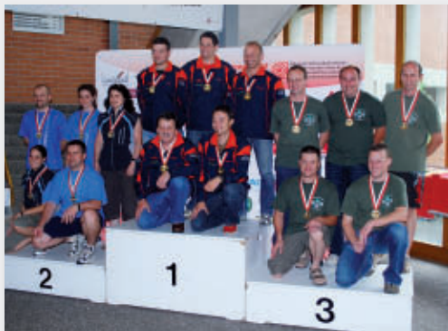
SSV Final GM G 50m Elite