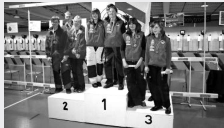
Berner Finaltage Münchenbuchsee Zollikofen GM G 10m Final Jugend 1. Thörishaus I 2. Thun-Stadt 3. Thörishaus II