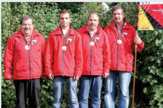
Sieger GM P 25m