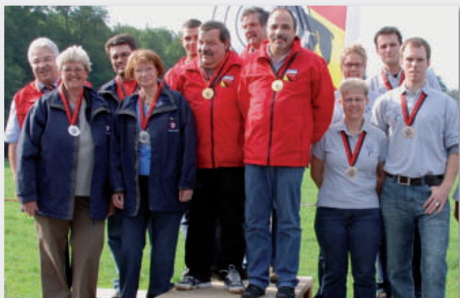
GM P 50m