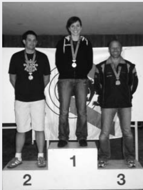
KM: Siegertrio, Liegendfinal G50m