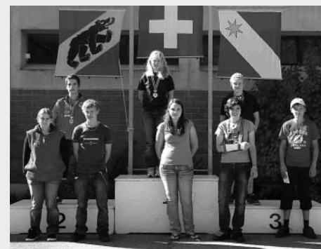
GM G50m Jugend