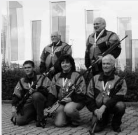
Schweizermeister Feld D Rüscheegg Graben FS