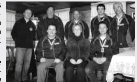
Heimenschwand Buchholterberg Schützen

Au nom de l'Association sportive bernoise de tir, nous félicitons les tireurs de Buchholterberg pour leur titre de Champion Suisse, au Championnat de groupes 2008, catégorie A.